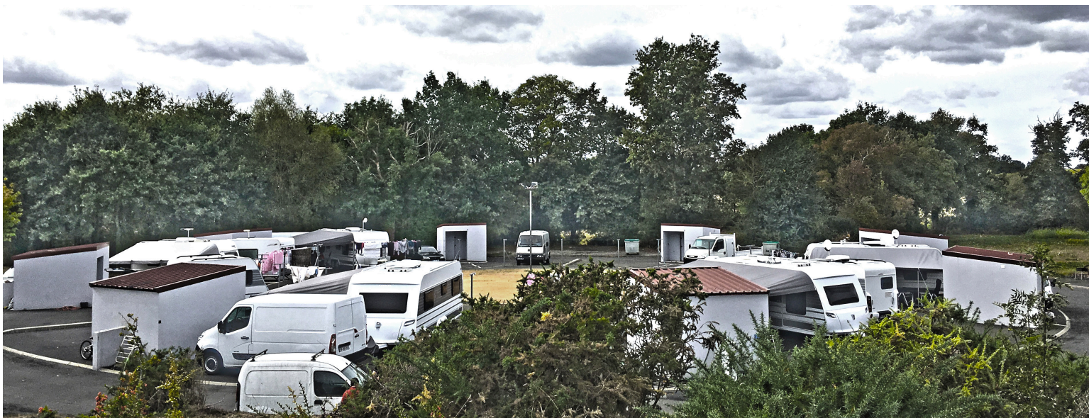
Aire d'accueil de Clisson®Le Relais